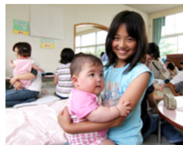
乳幼児医療費助成を充実させます