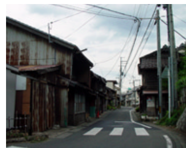
景観計画を策定して歴史ある町並みの保全を図ります