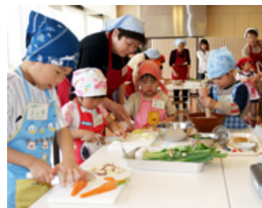
キッズ・キッチンなど食育事業を推進します