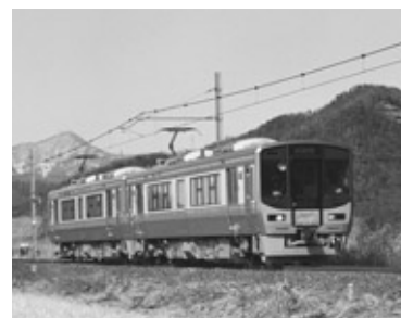
小浜線に快速電車を試験運転します