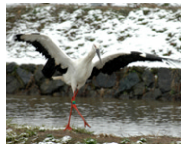
コウノトリを戻すために農村環境整備を行います