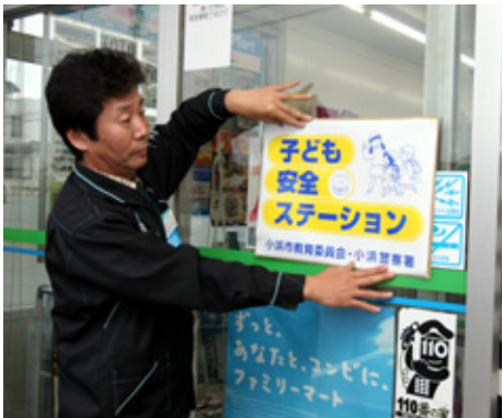
店舗入り口にステッカーを張る店主

市教育委員会と小浜警察署は四月五日、子どもたちの緊急避難場所となる「子ども安全ステーション」を設置し、市内のコンビニエンスストア九店舗にステッカーを配布しました。不審者などから逃れてきた子どもの安全を確保するとともに、日ごろから安全への配慮を心がけ、不審者が出没しにくい地域環境づくりを進めます。 今後は、官公庁や個人商店などに依頼し、同ステーションを増設してまいります。