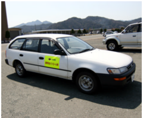
ステッカーを張った公用車

地域住民が丸となって子ども安全確保に取り組んでいる中、市でも三十台の公用車に「通学安全パトロール車」のステッカーを張り、移動時に子どもを見守る活動に取り組んでいます。