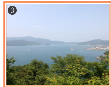
【久須夜ヶ岳と小浜湾】