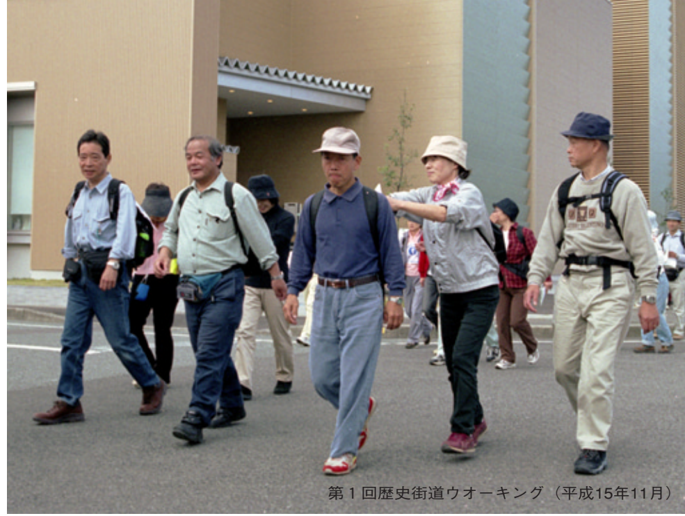
第1回歴史街道ウォーキング（平成15年11月）