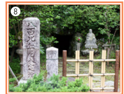
【八百比丘尼入定洞】