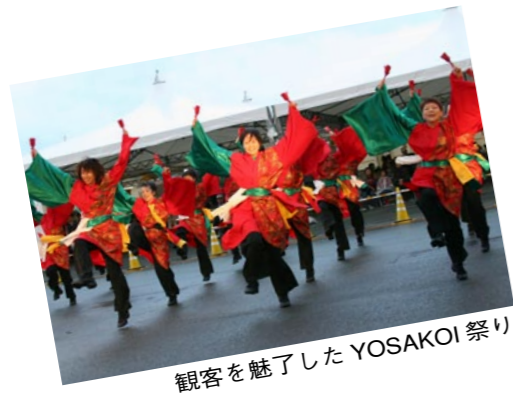
観客を魅了したYOSAKOI祭り