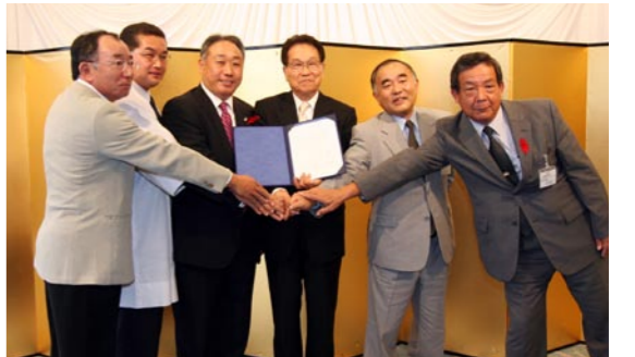
3県6市町が協定書を交わした御食国サミット