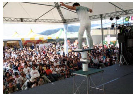
中国雑伎の華麗な技に大きな拍手