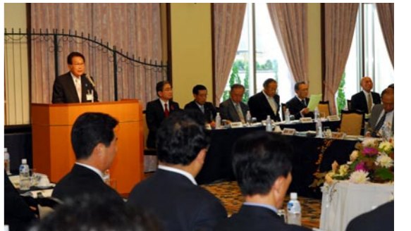
全国食のまちづくり大会は22府県46市町が参加