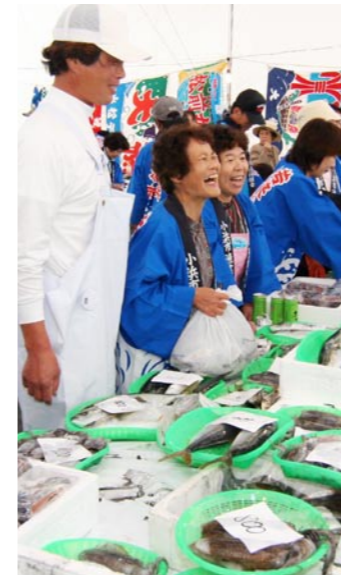
若狭おばまミニ大漁市