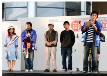
嶺南市町が地元をPR