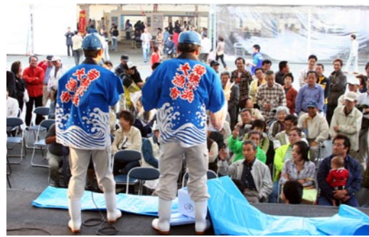
セリの気分を味わった素人セリ市