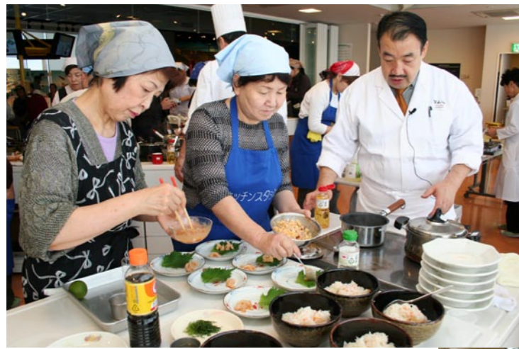
一流シェフから料理を教わりました