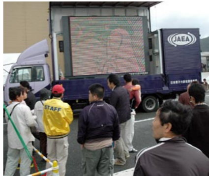
ビジョンカーを使った試写会