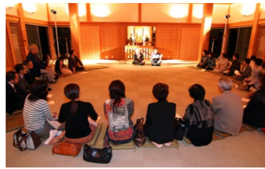
楽しい話とおいしい料理をいただいた食談会