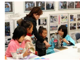
思い出の缶詰づくり