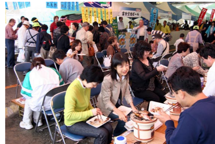
買ったばかりの魚を七輪で…おいしいね