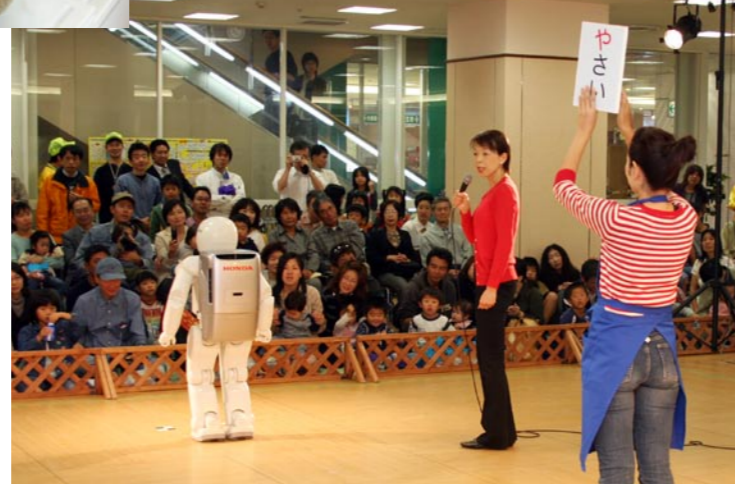
2足歩行ロボットアシモと食育