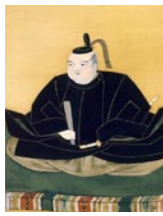
京極高次肖像 (清滝寺蔵)

慶長5（1600）年9月15日、東軍を率いた徳川家康は、関ヶ原で石田三成の指揮する西軍を破り天下を取りました。この戦いで、京極高次が1万を超える西軍を近江大津城に引き付け、関ヶ原へ向かわせなかった功績により小浜藩主となり、京極氏の再興を果たすとともに、若狭一国8万5千石を得て後瀬山城に入りました。