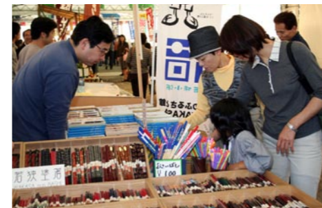
物産展では若狭塗箸も並びました