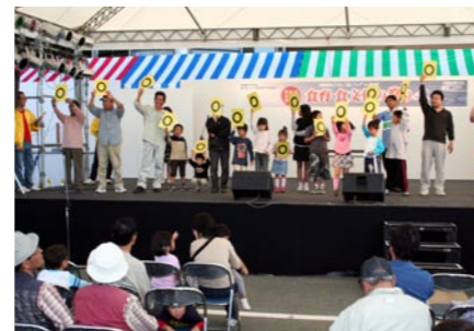
〇×クイズで小浜通を競いました