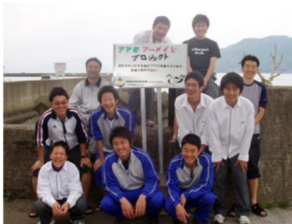
小浜水産高校 ダイビングクラブ

平成十七年、小浜湾を澄んだきれいな海にしようと小浜湾アマモマードプロジェクトを開始。環境浄化に効果があるとされるアマモ場の造成に精力的に取り組まれています。食をはぐくむ自然環境の保全と再生への取り組みは市民にも広がり、市が進める食のまちづくり推進に大きく貢献されています。