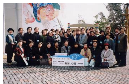
小浜市消費者協議会

昭和五十五年の設立以来、食品添加物や食品表示の研究などに取り組まれ、食の安全に対する消費者意識を向上させるなど食のまちづくり推進に尽力されています。また、環境にやさしい手作りせっけんの製作やリサイクル運動を積極的に展開するなど、食をめぐむ環境づくりに大きく貢献されています。