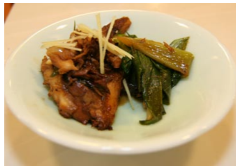
焼きサバと谷田部ネギの煮付け

(作り方) ①鍋に水を入れだし昆布をつけておく ②里芋の皮をむき適当な大きさに切る ③焼き麩を水で戻しておく ④シイタケ、かまぼこを薄切りにし、ニンジンは拍子切りにする。こんにゃくは熱湯で下湯し、細かい拍子切りにする ⑤①に火をかけ沸騰直前にかつお節を加える。沸騰したら昆布とかつお節を取り出す ⑥⑤に里芋、ニンジン、シイタケを加え、アクを取りながら煮る。柔らかくなったらこんにゃく、かまぼこ、焼き麩を入れ、薄口しょうゆ、塩を加える