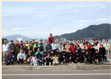
アマモサポーターズ

平成十七年に設立。小浜水産高校ダイビングクラブの皆さんが取り組む「小浜湾アマモマードプロジェクト」を市民レベルで支援されています。近隣の子どもたちや漁家組合員などと連携、協力し、市が進める食のまちづくり推進に大きく貢献していただいています。