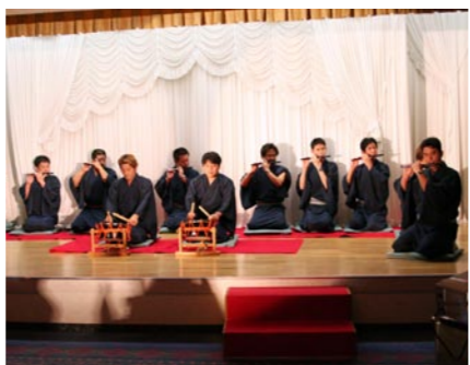
明日の放生祭を考える会

昭和六十一年、有志によるプロジェクトとして立ち上げられて以来、「放生祭」の存続発展と伝統文化の継承に尽力されています。平成八年に「明日の放生祭を考える会」として正式結成し、放生祭の知名度向上と演奏者の士気向上に努められ、市の文化振興に大きく寄与されています。