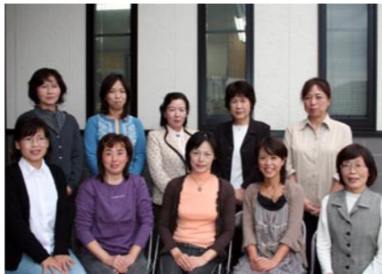
小浜児童文学会風夢

保育園、小学校、公民館などへ赴き、子どもたちに本の読み語り、エプロンシアター、紙芝居などを行っています。美しい言葉を子どもたちに語り、思いやりの心や感動する心をはぐくんでいきます。また、中学校では図書室の整理、本の紹介などを行い、読書の普及に努められています。