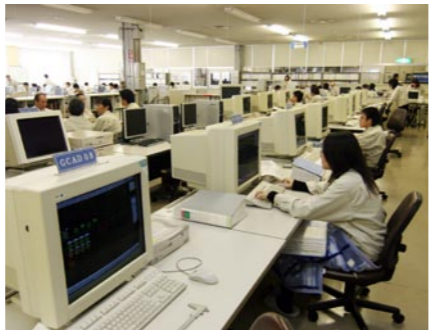
日本電産シバウラ(株)

昭和十八年、(株)芝浦製作所小浜工場として操業を開始。永年にわたり雇用、納税、周辺技術の振興などで貢献されています。また、中国平湖市に工場進出していることから、四月二十五日に結ばれた同市と小浜市との友好交流提携にも大きく貢献されました。