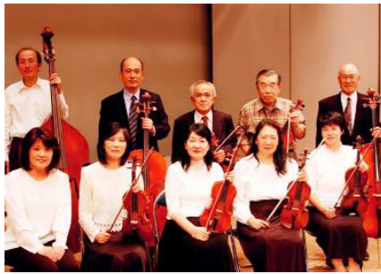
アンサンブル若狭

平成二年、弦楽器演奏愛好グループとして結成。文化会館を活動拠点とし、養護学校、友愛園など福祉施設への慰問などを行っています。同十年には市文化協会に加盟し、同年より市総合文化祭に出演。地方ではなかなか接することのできない、生の弦楽合奏を広く市民に聞いていただく活動をされています。