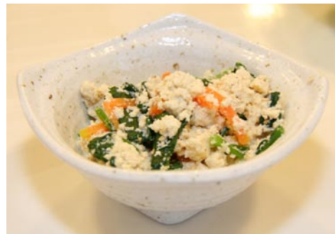
高野豆腐の白あえ風

(作り方) ①ホウレンソウは塩を入れた熱湯でゆでる。水であら熱を取って絞り、細かく刻み酒、薄口しょうゆを絡める ②コメを炊き、①の水分を軽く絞って混ぜ合わせる