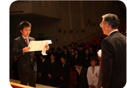
1月7日に行われた成人式

日本国内に住所を有する二十歳から六十歳までの人は、国民年金に加入して保険料を納付する義務があります。老後などに年金を受け取る権利があります。